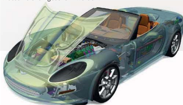
Einfaches und schnelles Weitergeben von detaillierten visuellen Informationen überall im Unternehmen.

Mit Creo View MCAD können wichtige Unternehmensdaten (z. B. Modelle, Zeichnungen und Dokumente) bei der unternehmensübergreifenden Projektzusammenarbeit mit Wasserzeichen geschützt werden.